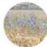
Akkerranden voor natuurlijke plaagbestrijding