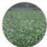
Kiekenvriendelijke teelt: luzerne en graan