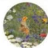
Akkerranden voor o.a. patrijs