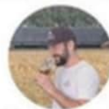
Streekproducten van lokale gewassen