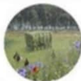
Luzerne als lokaal en hoogwaardig veevoer